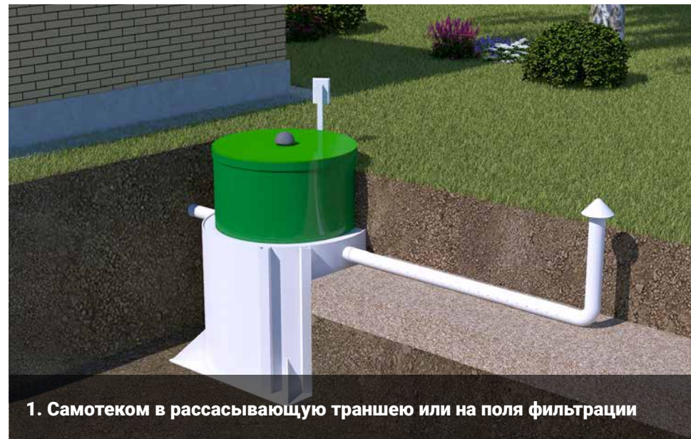
1. Самотеком в рассасывающую траншею или на поля фильтрации

Очищенная сточная вода удаляется из Изделия: