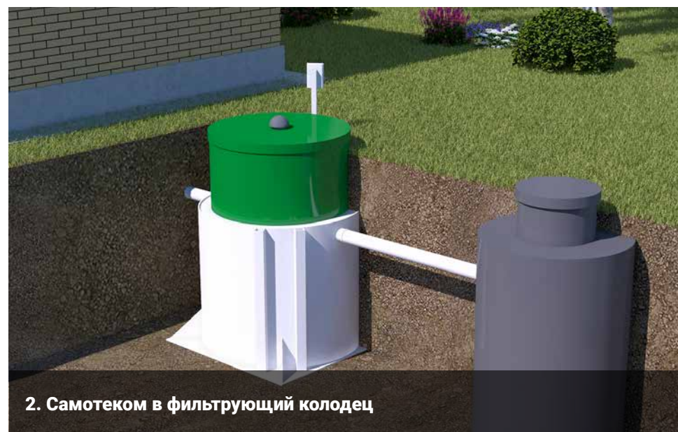
2. Самотеком в фильтрующий колодец