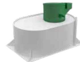
PEGAS мини (при высоком УГВ)