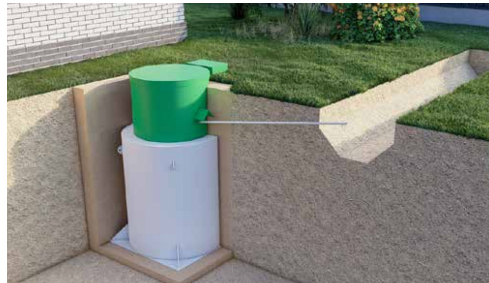
2. Принудительно на рельеф/ливневую канаву