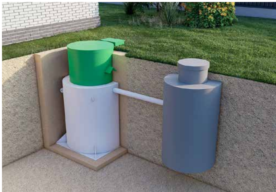
1. Самотеком в колодец фильтрующий/накопительный или глубокую канаву/овраг

Варианты отвода очищенной воды зависят от условий на участке и фильтрующей способности грунта: