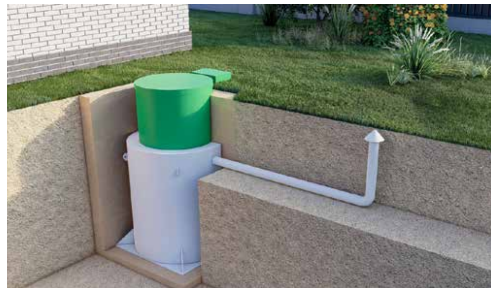
3. Самотеком в рассасывающую траншею или на поля фильтрации